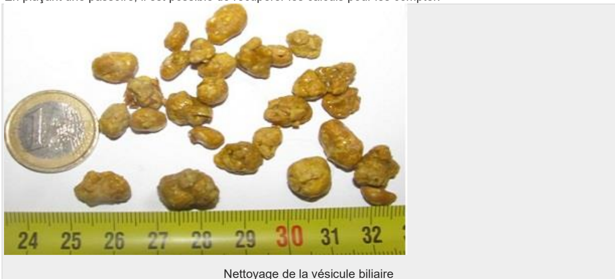
Nettoyage de la vésicule biliaire

Dans la matinée : le sel d'Epsom provoque une diarrhée très liquide. Les calculs surnageront dans les toilettes. En plaçant une passoire, il est possible de récupérer les calculs pour les compter.